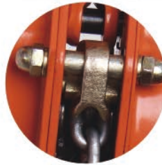
引导式导链装置 Load Sheave