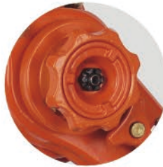
独特的手轮设计 Unique Anti-release System