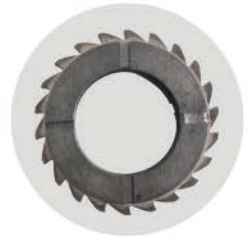
烧结摩擦片 Patented Fused Brake