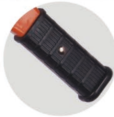
防滑手柄套 Anti-slip Handle